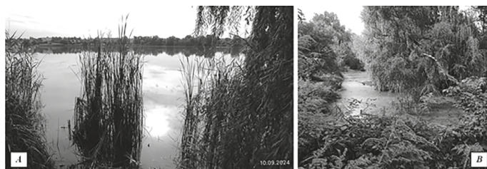
Рис. 4. Водойми Фастівського району Київської області з придатними умовами для виплоду кровосисних комарів: А — групи ставків Корчагін (с. Забір'я); В — дренажні водойми групи ставків Корчагін

в якій зустрічаються личинки комарів. Задамбовані ділянки групи ставків Корчагін уздовж берега мають цілий каскад мілководних та зарослих рослинністю дренажних водойм, в яких також присутні личинки комарів (рис. 3–4).