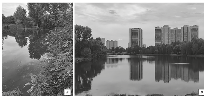
Рис. 3. Водойми Дніпровського і Дарницького районів м. Київ з придатними умовами для виплоду кровосисних комарів: А — оз. Малинівка; В — оз. Корольок

Інші озера, такі як Корольок і Малинівка, подекуди утворюють рясно порослу рослинністю заплаву,