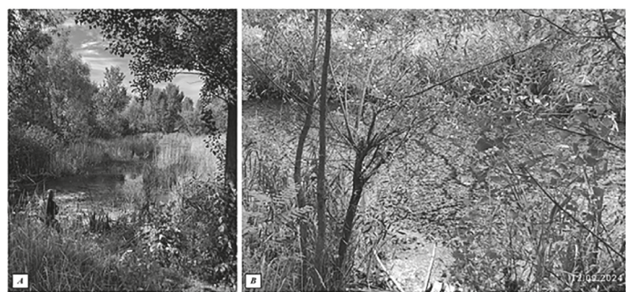
Рис. 2. Водойми Дарницького району м. Київ з придатними умовами для виплоду кровосисних комарів: А — оз. Кочерги; В — оз. Качине

Результати дослідження та їх обговорення. Під час обстеження 9 водойм личинки комарів було виявлено лише у 5 з них: озера Качине, Корольок, Кочерги, Малинівка та ставки Корчагін. Ці водойми характеризуються наявністю комплексу сприятливих умов для існування і розвитку личинок комарів. Деякі з цих водоймищ, зокрема озера Качине та Ко-